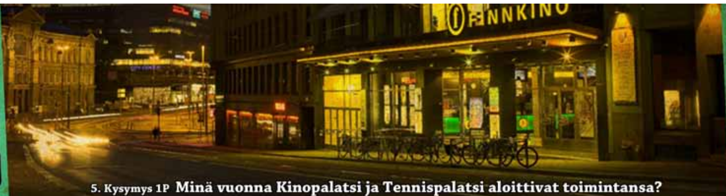
5. Kysymys 1P Minä vuonna Kinopalatsi ja Tennispalatsi aloittivat toimintansa?