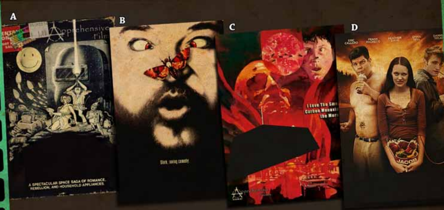
6. Kysymys 2P Tunnista leffaparodiat.